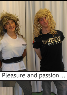
Pleasure and passion...