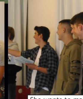
She wants to marry him, huhuhuhh!