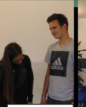
A big... sense of humour!