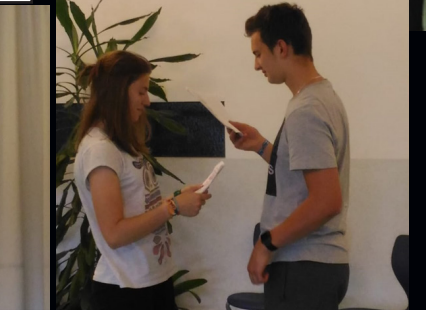
But...but... why, you are more beautiful than any girl I have met in all my travels!