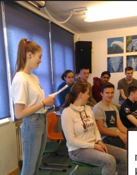
In the spring of a year in the 1300s...