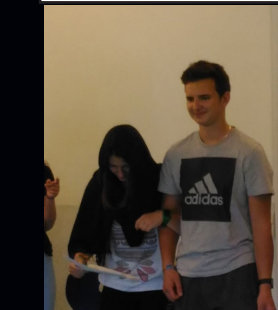
Come along, dear, we have got a wedding to prepare for!