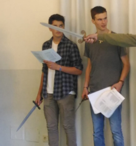
Death to this dirty piece of cow dung!