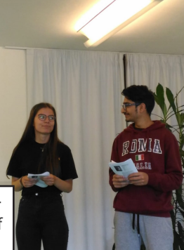
How blue the sky is, my lady