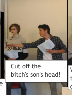
Cut off the bitch's son's head!