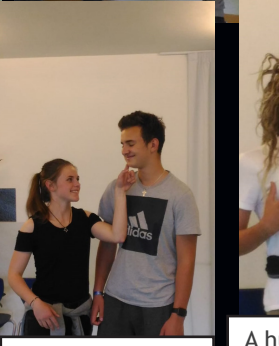
Joy and excitement...