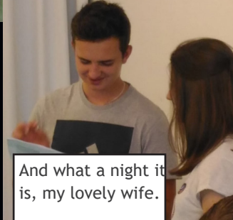
And what a night it is, my lovely wife.