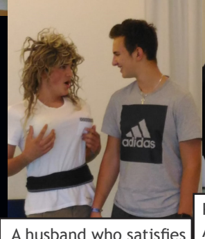
A husband who satisfies my every need!