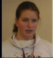
My tale is set in Camelot at the time of King Arthur