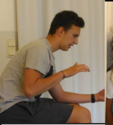
What is the thing that women most desire