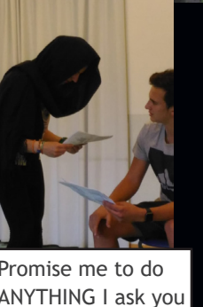
Promise me to do ANYTHING I ask you afterwards