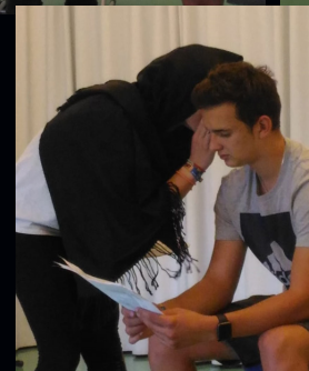
No woman... will say the answer is wrong...